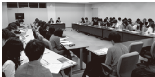
キックオフミーティングの様子

現代の大学生はお金と時間を何に消費しているのか。「モノ」だけでなく、「コト」に重きを置く価値観やそこに果たすSNSの役割など、今後さらにテーマ設定を深めたうえで7月に実査を行い、9月に調査結果の分析合宿を行う。11月末頃に調査報告書の発行およびプレス発表の予定。