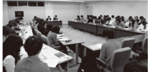
キックオフミーティングの様子

現代の大学生はお金と時間を何に消費しているのか。「モノ」だけでなく、「コト」に重きを置く価値観やそこに果たすSNSの役割など、今後さらにテーマ設定を深めたうえで7月に実査を行い、9月に調査結果の分析合宿を行う。11月末頃に調査報告書の発行およびプレス発表の予定。